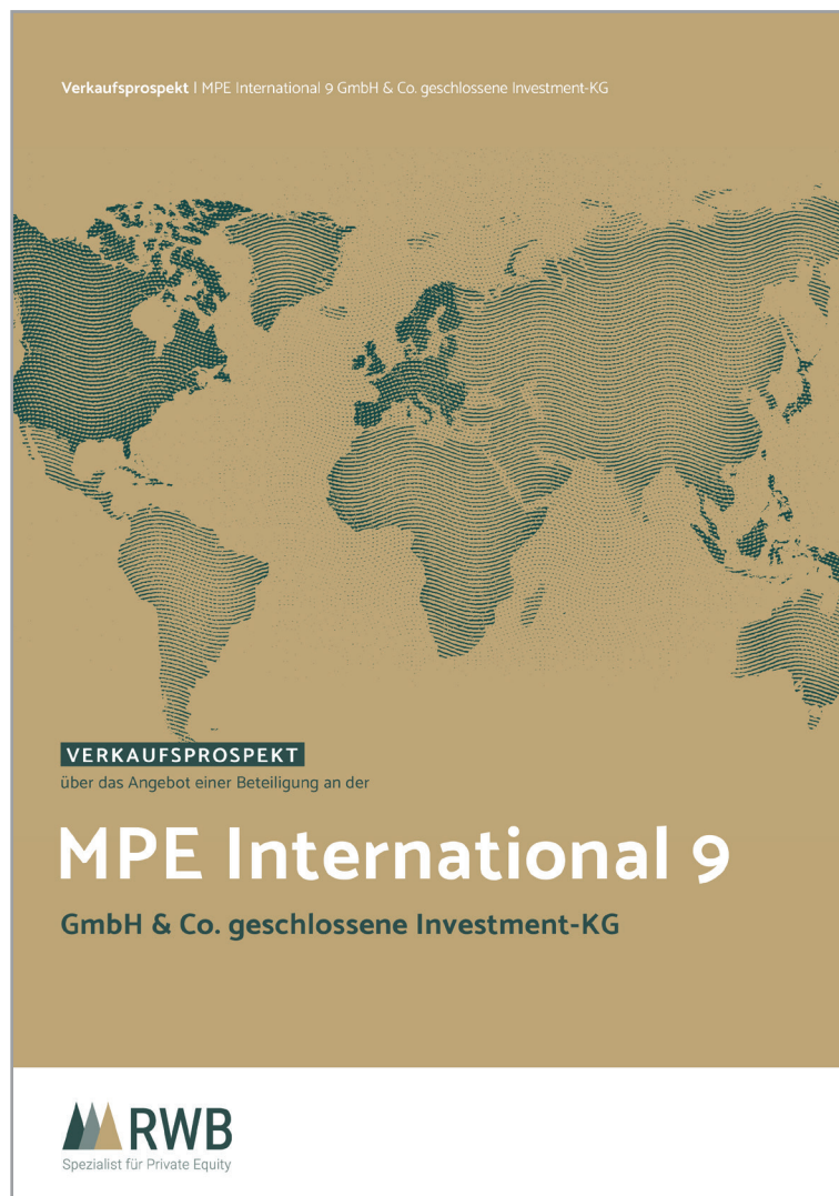
Abbildung: Titelseite des Verkaufsprospekts